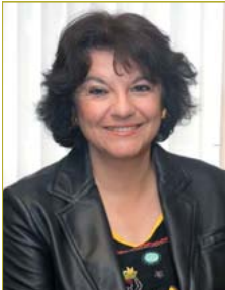
Soledad Murillo, Secretaria General de Políticas de Igualdad del Ministerio de Trabajo y Asuntos Sociales